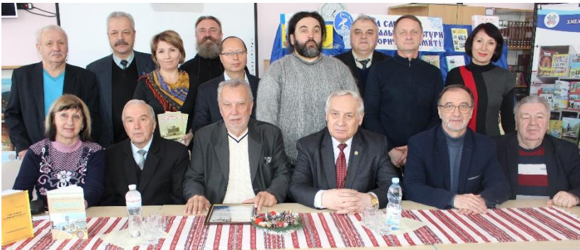
Новообрана президія Хмельницької обласної організації НСКУ. 14.12.2022 р.