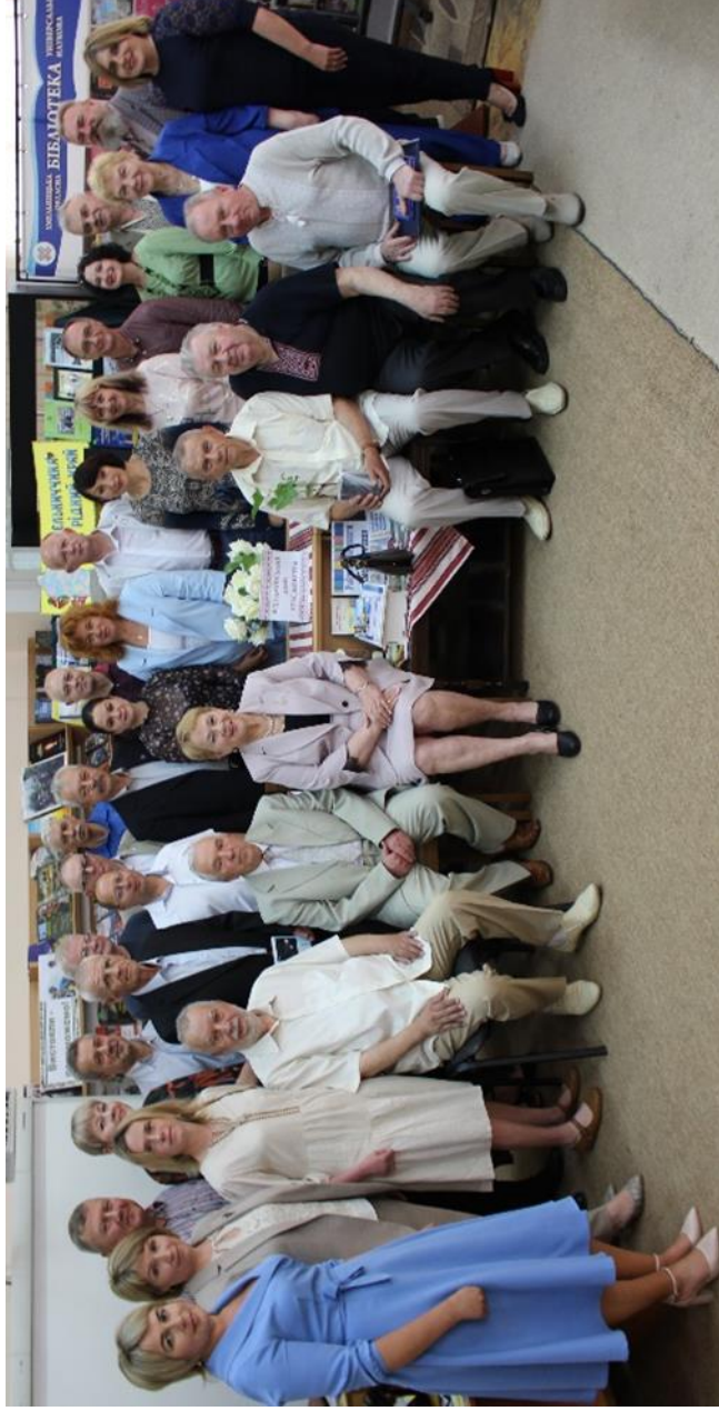
Учасники пленуму Хмельницької обласної організації Національної спілки краєзнавців України. 28.05.2024 р.