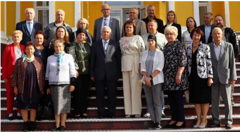
Доповідачі всеукраїнської науково-практичної конференції «Дунаєвеччина в умовах війни Росії проти України». 15.09.2023 р.