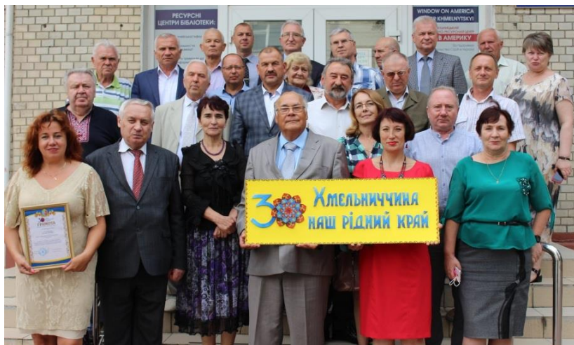
Учасники всеукраїнської науково-практичної конференції «Українська незалежність: 30 років поступу». 18.08.2021 р.