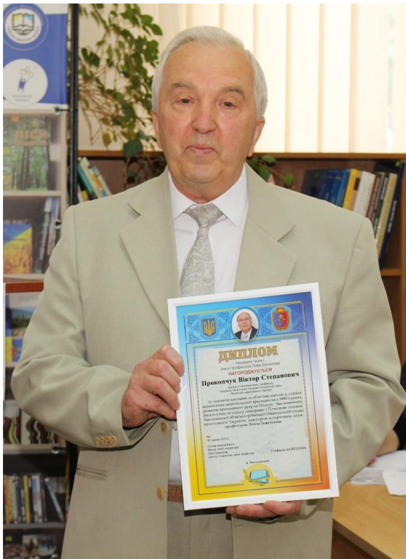
Перший лауреат премії імені професора Лева Баженова, пленум Хмельницької обласної організації Національної спілки краєзнавців України. 28.05.2024 р.