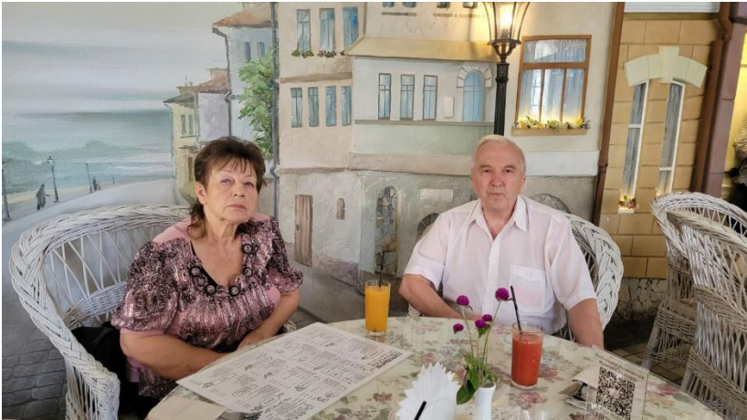
П'ятдесят три роки – поруч. 20.07.2023 р.