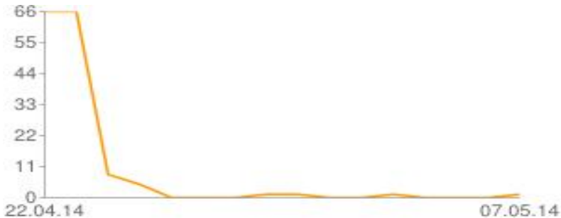
Мал. № 1. Гістограма: «Кількість відповідей респондентів по днях»

По кількості відповідей видно, що у опитуванні респонденти активно брали участь на протязі 2-х тижнів, що свідчить про їх зацікавленість та перегляд (бібліотечних сторінок, груп, спільнот) соціальних мереж та сайту обласної бібліотеки.