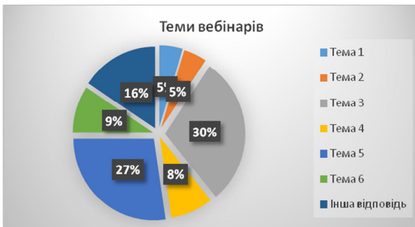
Мал. №3. Діаграма: «Динаміка актуальності прослуханих тем респондентами»