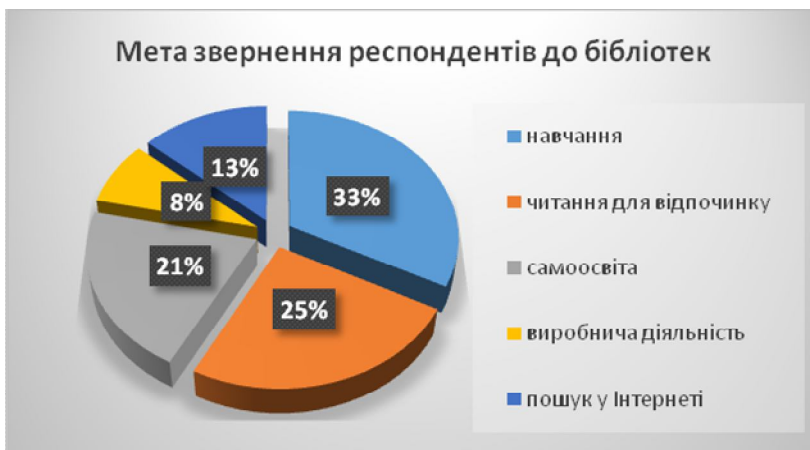
Мал. № 4. Діаграма: «Мета звернень респондентів до бібліотек Городоцького району»

Опитування дало можливість визначити місце бібліотеки в житті мешканців району, виявити пріоритети інформаційних потреб користувачів та ступінь їх задоволення. Надання доступу до мережі Інтернет відкриває для користувачів можливість доступу до інформаційних ресурсів бібліотек України та світу, та інших ресурсів. Велику роль в обслуговуванні користувачів відіграє якісне комплектування фондів бібліотеки, а також фаховий рівень працівників бібліотек, культура обслуговування, належна організація довідково-бібліографічного апарату та електронного каталогу, рекламна діяльність, створення та популяризація власних електронних ресурсів. Все це в комплексі сприяє якісному обслуговуванню користувачів бібліотек.