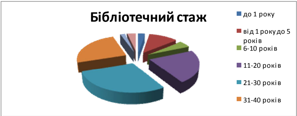
Мал. №3. Діаграма: «Бібліотечний стаж працівників, які пройшли навчання в РТЦ».