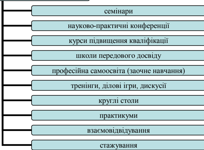
Мал. №3. Таблиця: «Форми підвищення кваліфікації в порядку значимості для респондентів».

На обговорення семінарів потрібно винести наступні проблемні питання методичної служби: