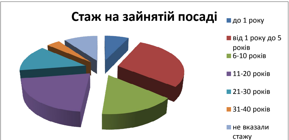
Мал. №4. Діаграма: «Стаж працівників на зайнятих посадах».

Не вказали стажу на посаді 25 (9,8%) респондентів.