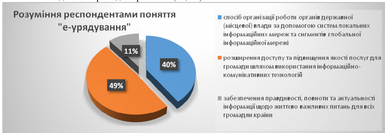
Мал. №3. Діаграма: «Обізнаність респондентів щодо поняття е-урядування».

На запитання: « Навіщо на Вашу думку громаді послуги е-урядування? » респонденти вказали свою думку: (Слід зазначити що на дане запитання, респонденти вказували по декілька відповідей, тому підрахунок відсотків вівся в відношенні від 100% на кожну відповідь.)