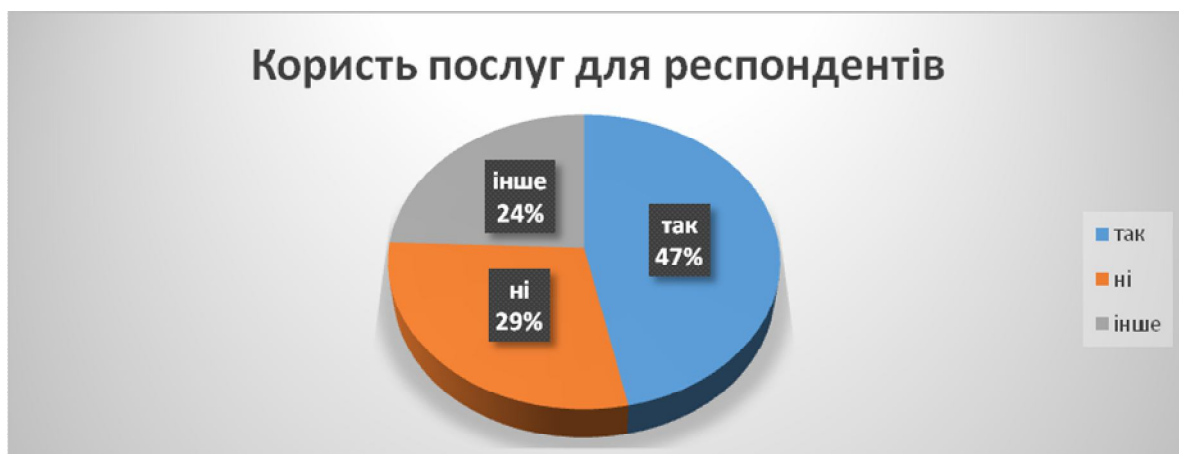
Мал. №5. Діаграма: «Динаміка користі від послуг е-урядування».