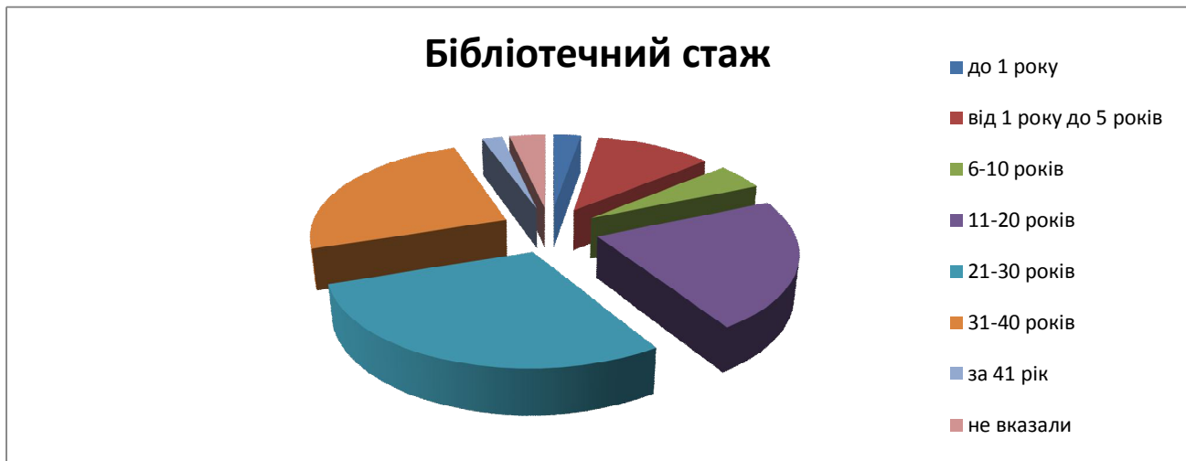
Мал. №3. Діаграма: «Бібліотечний стаж працівників, які пройшли навчання в РТЦ».

Не вказали стажу бібліотечної роботи 9 (3,5%) респондентів.