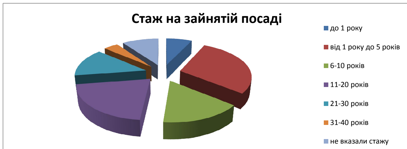
Мал. №4. Діаграма: «Стаж працівників на зайнятих посадах».

Не вказали стажу на посаді 25 (9,8%) респонденти.