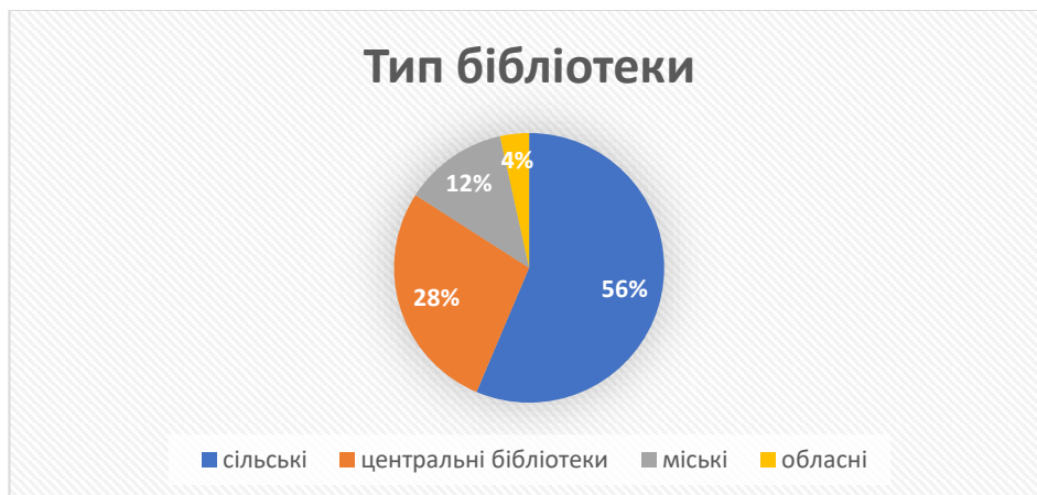
Малюнок 1. Діаграма «Тип бібліотек, респонденти яких взяли участь у дослідженні»